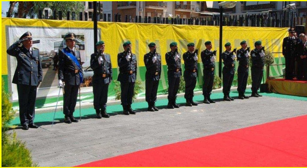
il picchetto in armi per la resa degli onori