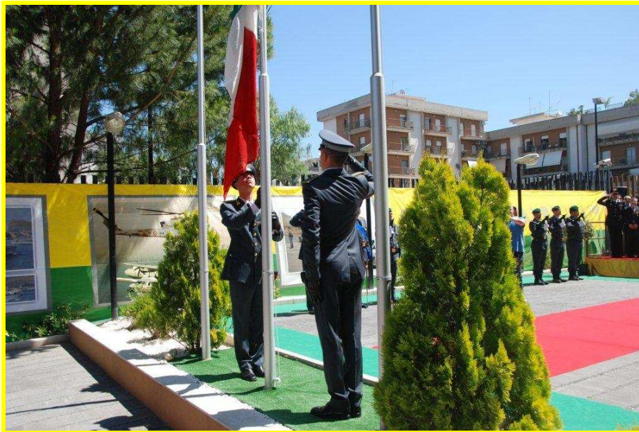
"l'Alzabandiera" sulle note dell'Inno di Mameli